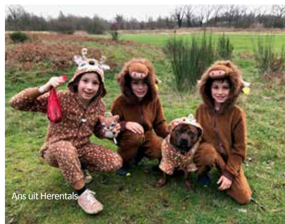
Ans uit Herentals

De 10 winnaars zijn bekend en ontvangen elk een cadeaubon van 50 euro. Hier de winnende foto's, 5 met de meeste likes op Facebook en 5 gekozen door de jury.