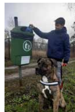
Leen uit Vorst-Laakdal