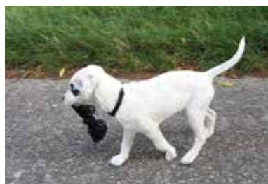
Simonne uit Herenthout