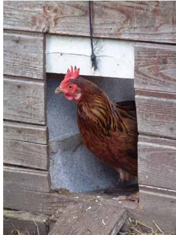
Een comfortabele inkomopening wordt door de kippen geapprecieerd.

De opening waarlangs de kip in het hok kan, maakt u zo'n 25 cm breed en 30 cm hoog. U richt de inkomopening naar het zuiden of het oosten. Staat ze toch in de richting van de heersende wind, dan beschut u ze door er een struik of een kleine schutting voor te plaatsen. Monteer een deur of klep waarmee u de opening en dus ook het hok kunt afsluiten. Dat is handig wanneer u een kip wilt vangen of wanneer u de dieren buiten wil houden om het hok te verversen. Wilt u het hok iedere nacht of voor langere tijd gesloten houden? Plaats dan een rooster in het deurtje zodat de luchtcirculatie in het hok niet verhinderd wordt. Verplicht de dieren vanaf de eerste nacht om binnen te slapen. Eens ze geleerd hebben om in een boom te slapen, leert u het ze niet makkelijk meer af!