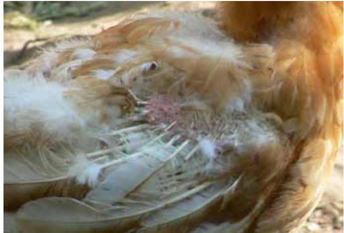
Een kip in de rui; op de kop en op de vleugels zijn nieuwe veerpennen te zien.