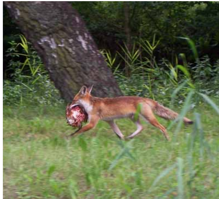
Zowat in heel Vlaanderen komt de vos opnieuw voor en bestaat de kans dat hij ook toeslaat in uw kippenhok.