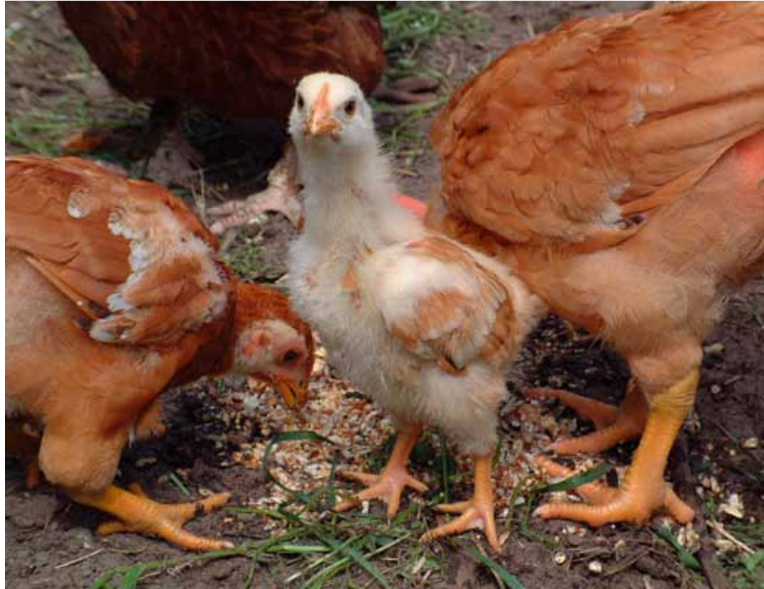
Mesthaantjes: hun bijdrage aan de verwerking van tuin- en keukenresten is beperkter dan die van legkippen.

Wilt u kippen vooral voor de eitjes houden? Kies dan voor een uitgesproken legras. Ook als verwerkers van organische resten zijn deze interessanter. U houdt een legkip immers het jaar rond. Een mesthaantje wordt slechts gedurende enkele weken intensief gevoederd. Dat vraagt extra meel en na de slacht moet u voor uw keukenresten toch weer een andere bestemming vinden. Mesthaantjes zijn dus niet zo ideaal voor de verwerking van tuin- en keukenresten. De gewone bruine of zwarte kippen die u op de markt koopt, zijn uitstekende leghennen die kort na de aankoop beginnen te produceren.