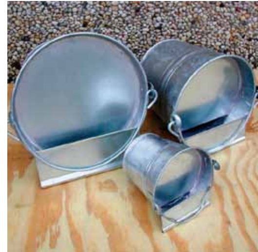
U vindt in de handel diverse drankautomaten voor kippen. Het water blijft langer proper zodat u het niet dagelijks hoeft te verversen. Plaats zo'n automaat op enkele stenen of hang hem op zodat er geen aarde in komt wanneer de kippen in de buurt in de grond of het strooisel scharrelen