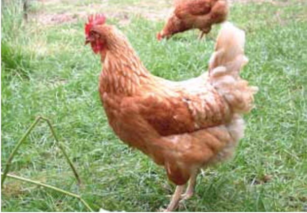
Dit soort roodpluimige, hybride legkip bevolkt het merendeel van de Vlaamse kippenrennen: sterk, actief én productief.