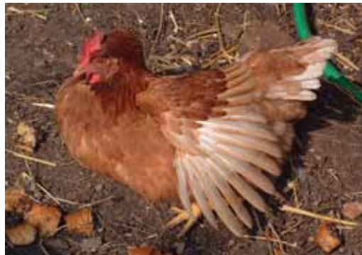
Rustig, één vleugel gespreid, geniet deze kip van het zonnetje.