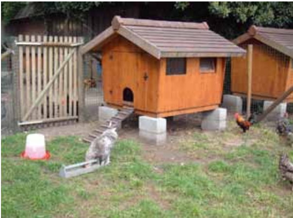
▼ Een overzichtsbeeld van ren en hok