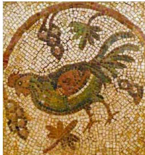
2000 jaar oud mozaïek, mét haan.

Onze voorouders hadden verschillende redenen om kippen te houden. Uiteraard kwam de productie van eieren en vlees op de eerste plaats. In iedere streek ontwikkelden zich specifieke rassen met eerder leg- of eerder vleeskenmerken. Kippen waren ook een manier om in natura te betalen. Het selecteren en kweken van sierrassen is een sport die uit de vorige eeuwen dateert en vandaag nog heel wat liefhebbers kent. In de loop van de geschiedenis kende het kweken van kippen een wisselend succes.