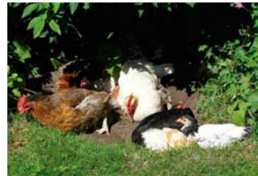
Kippen zijn van oorsprong boshoenders. Een ganse dag in de volle zon is niets voor hen. Vogels hebben geen zweetklieren. Ze moeten afkoelen door vocht te verdampen via hun bek.