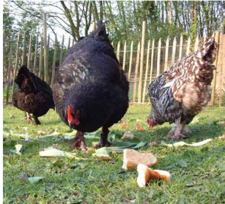
Kippen zijn goede verwerkers van tuin- en keukenresten