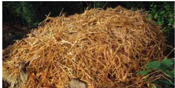
Houtkrullen en stro zijn ideaal als strooisel in het binnenhok.