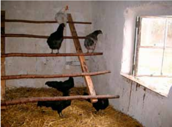
▲ De zitstok, het hoogste punt in het binnenhok.