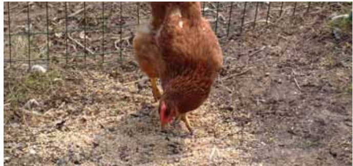
Verhoog de aantrekkingskracht van het scharrelmateriaal in de buitenren door er dagelijks een handvol graan tussen te gooien.