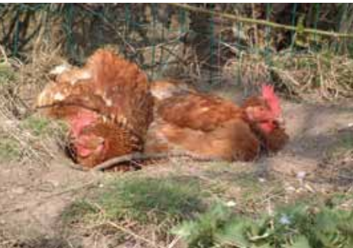
Regelmatig een stofbad kunnen nemen is erg belangrijk voor de gezondheid van de kip.

een olieachtige substantie op. Deze wordt uitgescheiden door de stuitklier en maakt de pluimen waterafstotend. Uithijgen doen ze het liefst in de schaduw . Een struik in of naast de ren vinden ze prima. Plant een inlandse soort zoals vlier die heel wat insecten aantrekt, bladeren en bessen levert en goed tegen een stoot of grondige snoei kan. Plant u hem in de ren, leg dan rond de voet een stuk afsluitdraad van ongeveer een vierkante meter. Zo scharrelen de kippen hem niet met wortel en al uit de grond. De struik doet meteen ook dienst als beschutting tegen wind. Denk er wel aan dat kippen de takken als opstapje durven gebruiken om over de omheining te vliegen.