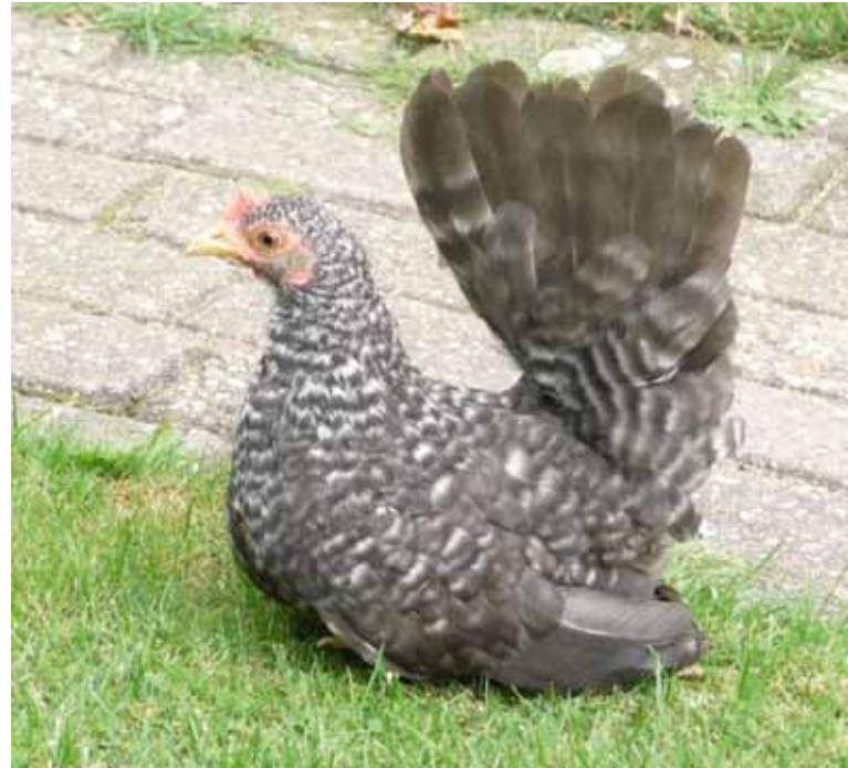
Wist je dat een koekoek geen kippenras is? Koekoek is slechts een kleurslag. Deze kip heeft een koekoekkleur.