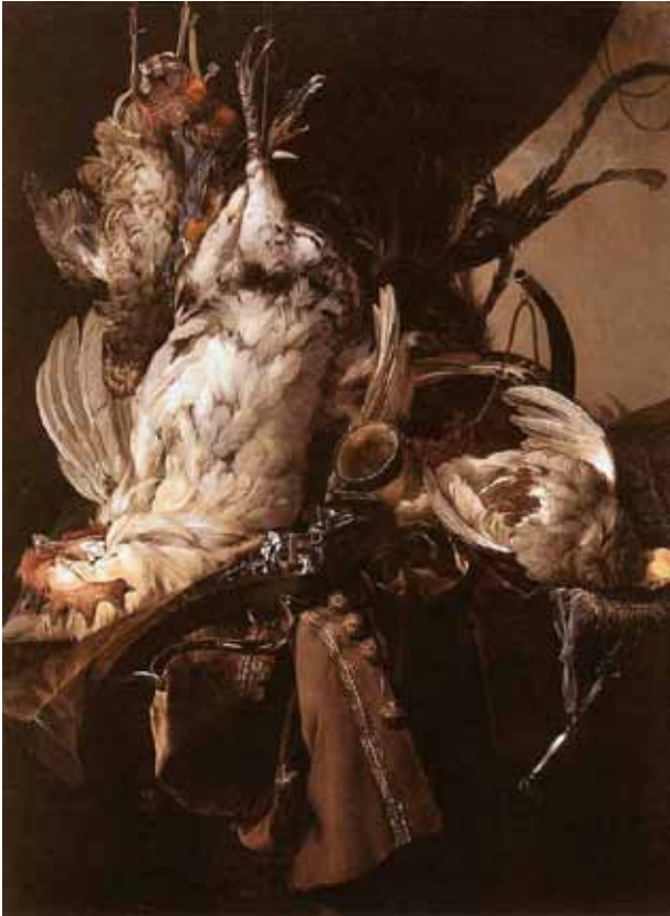
Barok stilleven, mét kip.

Vooral tijdens oorlogen en hongersnood daalde de populatie aanzienlijk. Maar ook tijden van welvaart kunnen voor kippen moordend zijn. De laatste decennia evolueerde de tuincultuur zeer sterk in de richting van de siertuin. Steeds minder gezinnen hebben een nutstuin. Plaatselijke rassen worden zeldzamer en voor velen is de grootouderlijke kennis over kippen volledig verloren gegaan. In sommige verkavelingen is het bouwen van een kippenhok zelfs verboden.