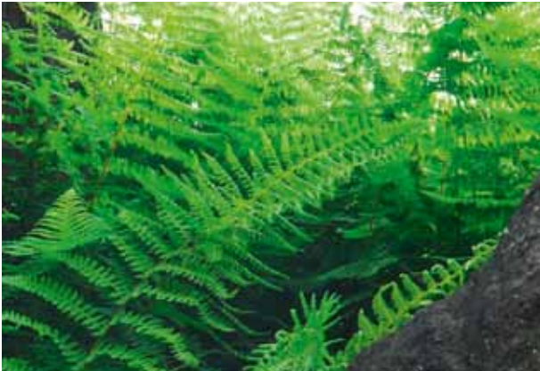
Een veel voorkomend probleem bij legnesten is de rode vogelmijt. U kunt deze mijtensoort voorkomen door gedroogde bladeren van varens of tabak in het nest te leggen

Hoewel u met één nest in principe voldoende hebt voor 4 à 5 kippen, zal een tweede nest zelfs bij drie kippen nog dankbaar gebruikt worden. In de bakjes legt u een dik pak gehakt stro, hooi, kokosvezel, houtkrullen of een ander zacht materiaal. Met een kalkei in het nest kunt u suggereren om in het nest te leggen.