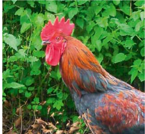
Wanneer u toch een haan wenst, houd het dan bij één exemplaar.