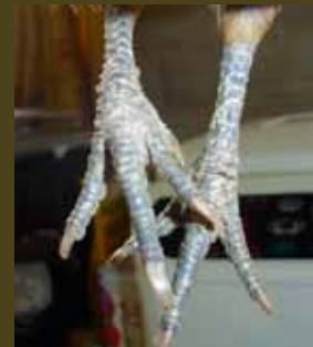
Een door kalkpootmijt aangetaste kippenpoot is ruw en dik.