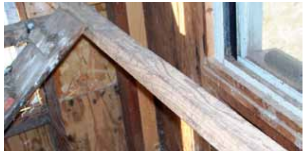
Voor de meeste rassen is de bekende panlat perfect bruikbaar als zitstok