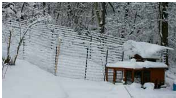
Bij sneeuw of erg koud weer houden de kippen zich meestal gedeisd in hun binnenhok.

Een goede leghen legt tijdens het eerste jaar, wanneer ze in topproductie is, gemakkelijk 250 eieren per jaar. Na 2 à 3 jaar neemt de leg af. Na 4 à 5 jaar bedraagt de productie minder dan de helft.