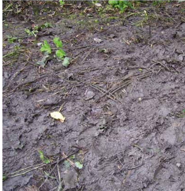
Modderpoelen veroorzaken geurhinder, bevatten ziektekiemen en het voedsel raakt erin besmeurd.

Zware grond draineert slecht en is gevoeliger voor moddervorming dan pakweg zandgrond. Modderpoelen zijn hoe dan ook te vermijden . Als er toch modder ontstaat, dan grijpt u best in. Modderpoelen veroorzaken geurhinder, bevatten ziektekiemen en het voedsel raakt erin besmeurd. Ook andere verontreinigingen zijn te vermijden. Vervuilende stoffen in de bodem worden rechtstreeks of via de wormen door de kippen opgenomen en komen in de eieren terecht.