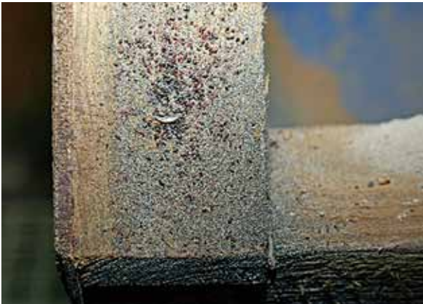
Een typisch beeld van samengetroefte rode vogelmijten

Neem de dieren regelmatig vast en controleer ze - zeker bij warm weer - op parasieten. Inspecteer ook het hok en check in het bijzonder de uiteinden van de zitstokken op rode vogelmijt. Hou de dieren vooral tijdens de rui goed in de gaten.