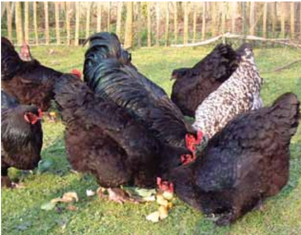
Een actieve kip is een gezonde kip!