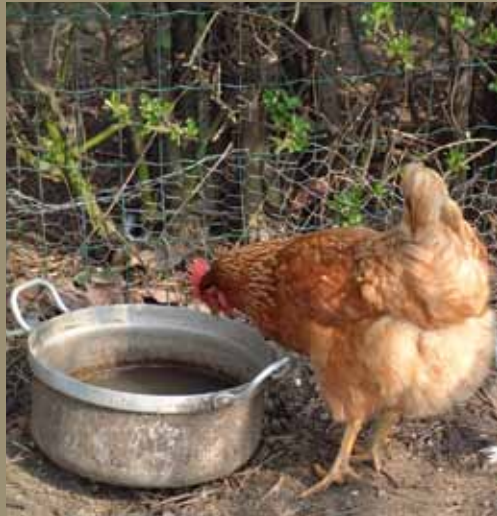
Zorg ervoor dat de kippen over een rand moeten drinken, bijvoorbeeld uit een oude kookpot. Zo vervuilen ze het water niet te snel.