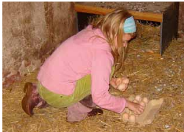
Wanneer u dagelijks de eieren raapt, krijgt u ook een goed beeld van de gezondheidstoestand van uw kippen

als het donker is en de dieren definitief op stok zitten. Denk er aan dat een goede ventilatie vooral 's nachts van belang is. Breng de luchttoevoer niet in gevaar wanneer u het hok afsluit.