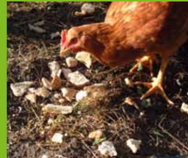
Typische keukenresten: brood, gekookte aardappelen en groenten.