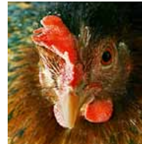
Kip met een mooi gevormde snavel

Een meer ingrijpende behandeling die kippen nog steeds vaak ondergaan, is het kappen van de snavel . Daarbij wordt tot een derde van de bovensnavel verwijderd. Deze ingreep gebeurt in principe enkel wanneer een heleboel dieren zo dicht moeten samen zitten dat ze mekaar zouden kwetsen of zelfs dood zouden pikken. Kippen die uw keuken- en tuinresten moeten verwerken, houden uiteraard maar beter hun volledige bek.