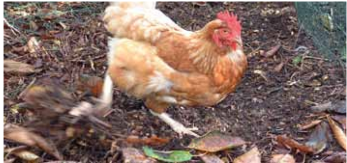
Wie scharrelt, die vindt.

De keuken- en tuinresten die u hen geregeld aanbiedt, zijn al een stap in de goede richting. Tussen een pak strooisel van bladeren of houtsnippers vinden de kippen meestal voldoende beestjes om het scharrelen zinvol te houden. U kunt bovendien ook onkruid in bussels in de ren ophangen of onkruid in een ruif stoppen, net boven de hoofden van de kippen. Zo worden ze verplicht om ook eens hun nek uit te steken.