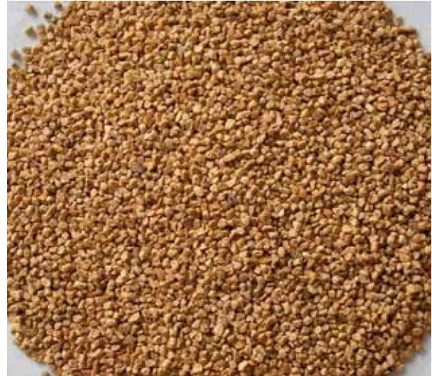
In de handel vindt u een mengsel van grit (steentjes) en maagkiesel.

Kippen moeten steeds kunnen beschikken over vers en zuiver water. Verschaf zo'n 250 ml per kip en per dag of een liter water per toom van 4 kippen per dag. Plaats de drinkbak niet te ver van de voederbak, zodat de kippen tijdens het eten ook kunnen drinken. Plaats hem zo mogelijk buiten het hok om te voorkomen dat het strooisel vuil wordt. De drinkrand bevindt zich best op borsthoogte van de kip. Ververs in de zomer het water dagelijks. Plaats de drinkbak in de schaduw en reinig hem regelmatig. Bij hogere temperaturen is er namelijk een versnelde groei van algen en bacteriën.