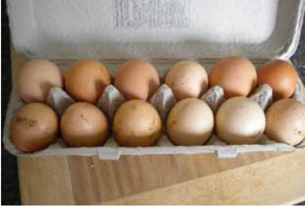
Ververs het stro in het legnest als het vervuild is door uitwerpselen. Zo voorkomt u besmeurde eieren.