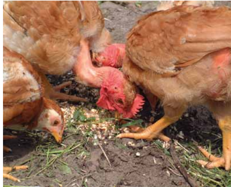
Een vrij groot aantal kippen op een beperkte oppervlakte. Hier kan de pikorde een ongewenst effect hebben.

Wanneer u enkele kippen samen in een groep of toom plaatst, ontstaat na korte tijd een bepaalde rangorde. De hoogste kip in rang mag alle andere kippen pikken, de kip die op de tweede plaats staat, pikt alle andere behalve die ene die boven haar staat... Dit noemt men de pikorde. Zolang de dieren voldoende plaats hebben om rond te lopen, te slapen, eieren te leggen ... is er voor de laagste in rang geen probleem. Ze kent haar plaats en neemt er vrede mee. Is er echter aan één van deze behoeften een tekort, dan is zij de dupe. Alle andere kippen zullen zich op haar afreageren. Dit kunt u maar beter vermijden. Wanneer u nieuwe kippen aan een toom toevoegt, moet de pikorde vaak opnieuw worden uitgevochten. De nieuwelingen nemen immers niet altijd vrede met de laagste plaats. Dit kan enkele uren tot dagen in beslag nemen. Een tip: wanneer u de nieuweling 's nachts in het hok bij de andere kippen zet, dan wordt ze 's morgens veel beter aanvaard door de rest. Wanneer u maar één kip toevoegt, houdt u hoe dan ook beter een oogje in het zeil.