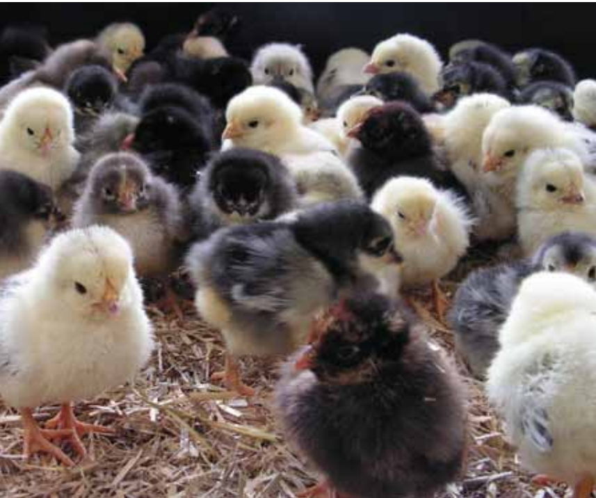
Kuikens van hybride kippen: een allegaartje van de kenmerken van haan en hen.

Naast de zuivere raskippen zijn er de kruisingen. Soms worden rassen heel doelgericht gekruist. Men spreekt dan van hybriden. Deze hybriden combineren bepaalde eigenschappen van de verschillende rassen van het vader- en moederdier. Hybride kippen worden in grote kwekerijen gefokt en zijn vooral bestemd voor de (bio)industrie. Maar ook de rosse of zwarte kippen die u op de markt vindt, zijn doorgaans hybride exemplaren. U kunt met een hybride kip kweken, net als met enig ander kippenras. Hybride kippen hebben niets met genetische manipulatie te maken, en het woord 'hybride' betekent evenmin dat deze kippen steriel zouden zijn. Bij het verder kweken zullen de kuikens de nagestreefde eigenschappen meestal verliezen.