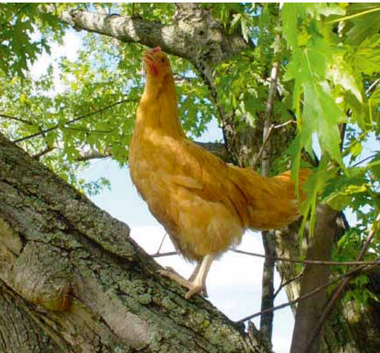
Hoog en droog in de boom. Probeer die maar eens te vangen!

Naast deze 'goeie redenen' willen we u ook graag enige aandachtspunten mee geven: