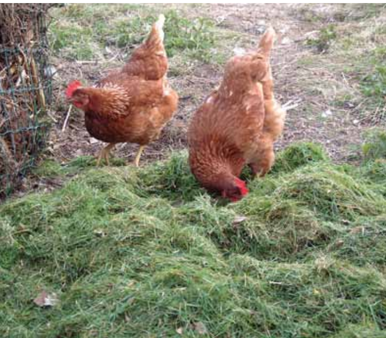
Geef het grasmaaisel en andere tuinresten niet in dikke pakken, maar strooi het uit. De laag wordt zo niet te dik. Dit voorkomt broei of rot.

Geef niet meer keukenresten dan wat tegen de avond opgegeten wordt. Verwijder eventueel wat over blijft, want etensresten trekken ongedierte aan.